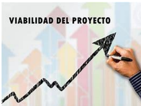
ESTUDIOS DE VIABILIDAD